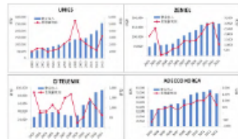
图 1 韩国经营历史最长的四家人力服务企业历年经营业绩 (单位: 百万韩元) 注: 2015 年 2 月, 1 元人民币的兑换 175 韩元。

但是, 在此期间, 四家公司的息税前利润, 都出现了大幅度的波动。从息税前利润的波动系数 (标准差/平均值) 来看, ADECCO KOREA 高达 95.32%, ZENIEL 和 UNIES 分别为 64.96% 和 60.26%, 波动幅度最小的 CJ TELENIX, 仍然达到了 48.53%。因此, 从这四家公司十余年以来的利润波动来看, 人力资源企业在业务量及营业收入保持增长的情况下, 盈利仍然可能由于诸多因素, 起伏较大。